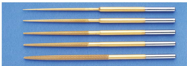
■ 空気圧・電動工具 BY AIR ACTING or ELECTRIC INSTRUMENTS